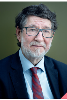
Alain ANZIANI Maire de Mérignac Président de Bordeaux Métropole