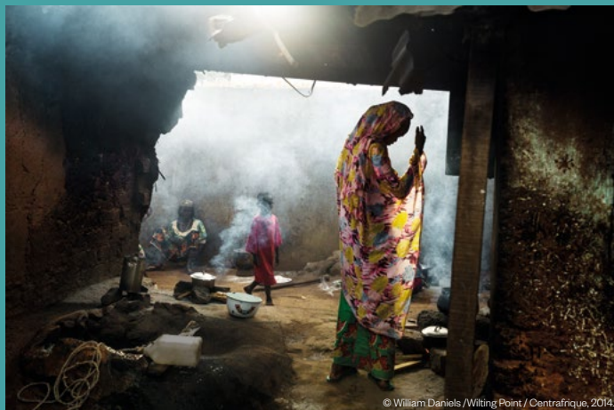
© William Daniels / Wilting Point / Centrafrique, 2014.

Suite à une expérience assez dangereuse en Syrie en 2012, je suis devenu assez craintif et donc beaucoup plus prudent. Je passe assez peu de temps sur les lignes de front, que d'ailleurs je photographie assez mal. Je suis plus intéressé pas des « à côté », le contexte, des situations en retrait, des atmosphères qu'une représentation directe de la violence et la couverture factuelle d'un conflit.