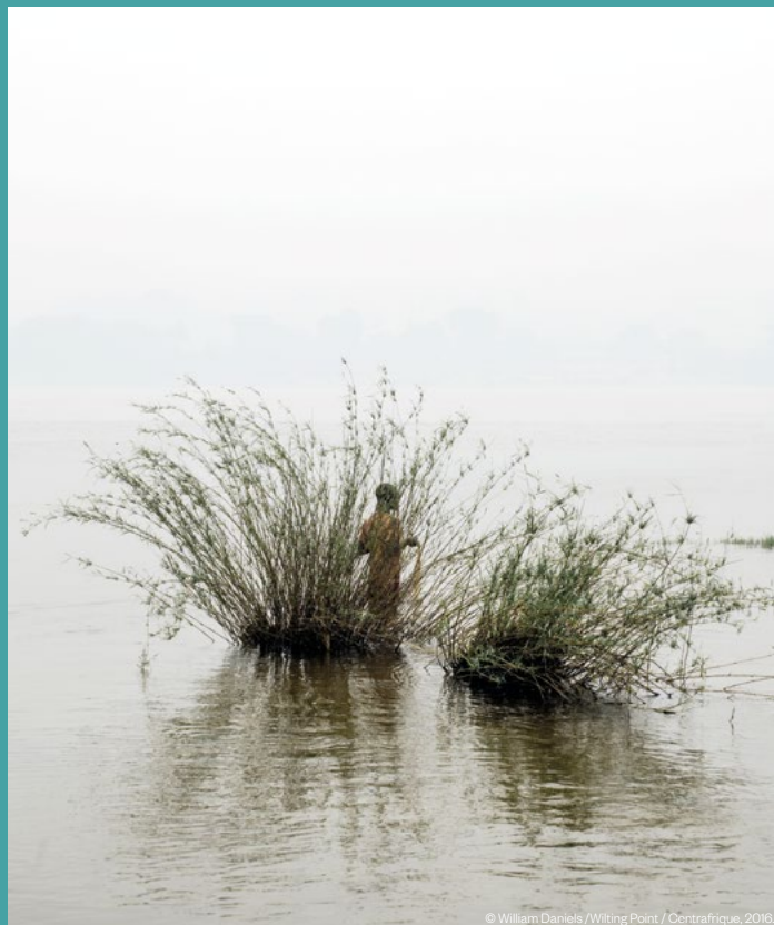
© William Daniels / Wilting Point / Centrafrique, 2016.