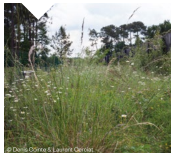
© Denis Coïnte & Laurent Cerciati.