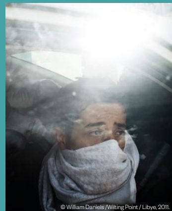
© William Daniels / Wilting Point / Libye, 2011.

Visite Regards Décalés. SAMEDI 8 JUIN – 14H