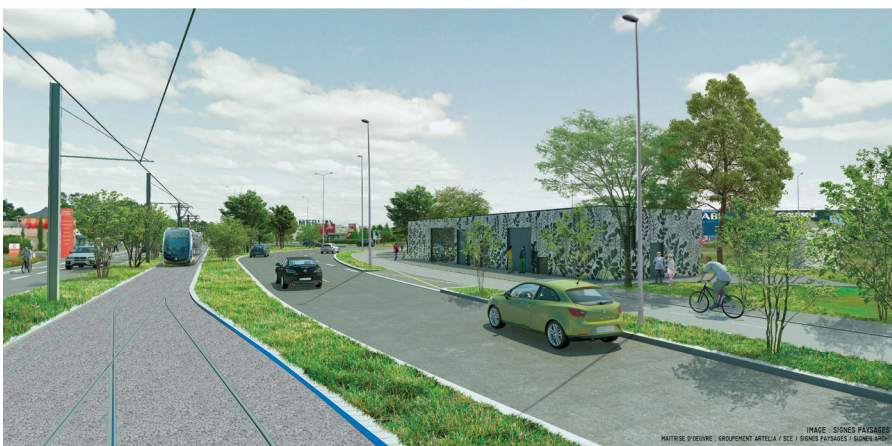
EXTENSION DE LA LIGNE A DE TRAMWAY VERS LA ZONE AÉROPORTUAIRE - AVENUE KENNEDY INTRA ROCADÉ - SSR ET CARREFOUR VIGNEAU

MATRIERE D'OEUVRE : GROUPEMENT ARTELLA / SCE / SIGNES PAYSAGES / SIGNES AEROC