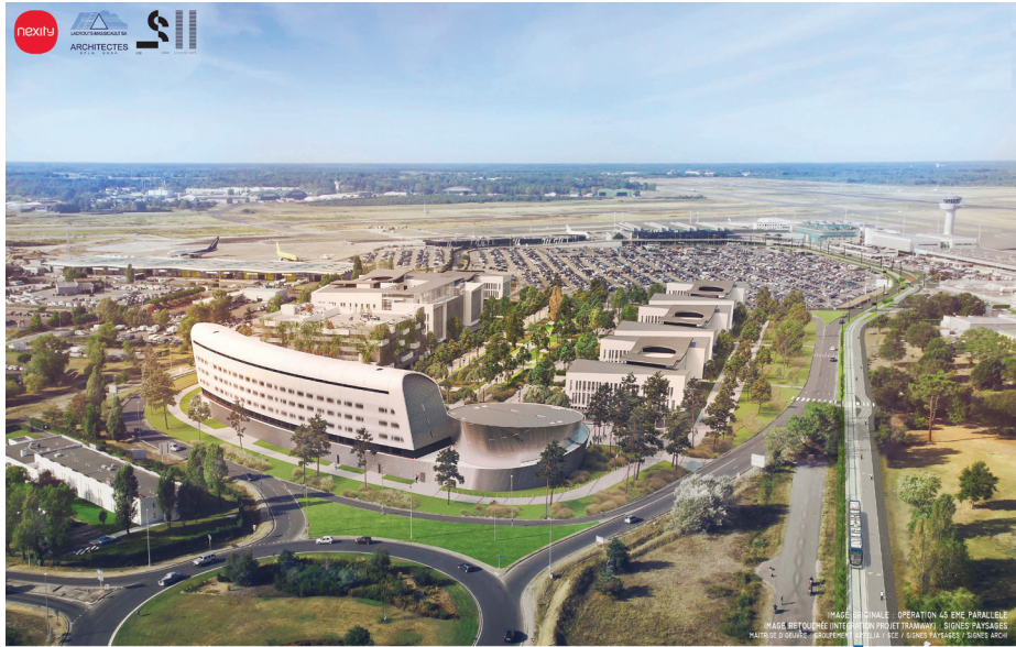
EXTENSION DE LA LIGNE A DE TRAMWAY VERS LA ZONE AÉROPORTUAIRE - ZONE AÉROPORTUAIRE - SECTEUR 45 EME PARALLELE

IMAGE D'ORIGINE : OPERATION 45 EME PARALLELE IMAGE REFOURMEE INTERIEUR PROJET TRAMWAY / SIGNES PAYSAGES MATRIERE D'OEUVRE : GROUPEMENT ARTELLA / SCE / SIGNES PAYSAGES / SIGNES AEROC