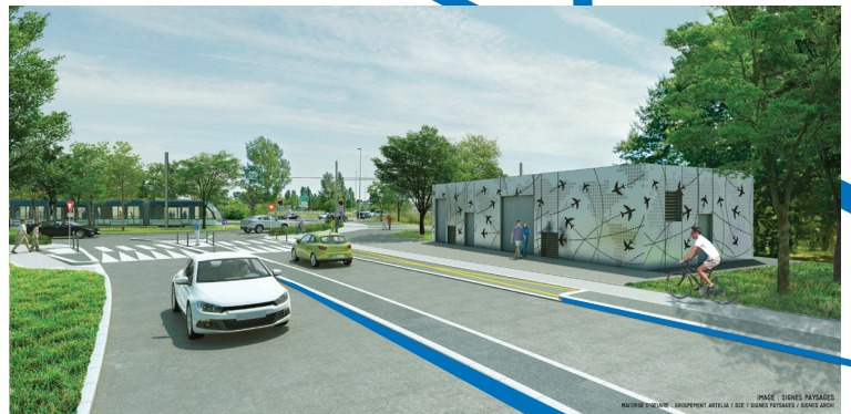
EXTENSION DE LA LIGNE A DE TRAMWAY VERS LA ZONE AÉROPORTUAIRE - SECTEUR BEAUDESERT

IMAGE : SIGNES PAYSAGES MATRIERE D'OEUVRE : GROUPEMENT ARTELLA / SCE / SIGNES PAYSAGES / SIGNES AEROC