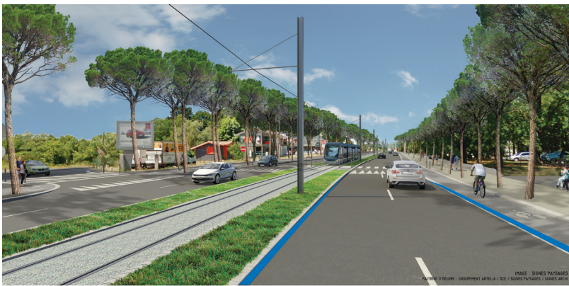
EXTENSION DE LA LIGNE A DE TRAMWAY VERS LA ZONE AÉROPORTUAIRE - AVENUE KENNEDY INTRA ROCADÉ

IMAGE D'ORIGINE : OPERATION 45 EME PARALLELE IMAGE REFOURMEE INTERIEUR PROJET TRAMWAY / SIGNES PAYSAGES MATRIERE D'OEUVRE : GROUPEMENT ARTELLA / SCE / SIGNES PAYSAGES / SIGNES AEROC