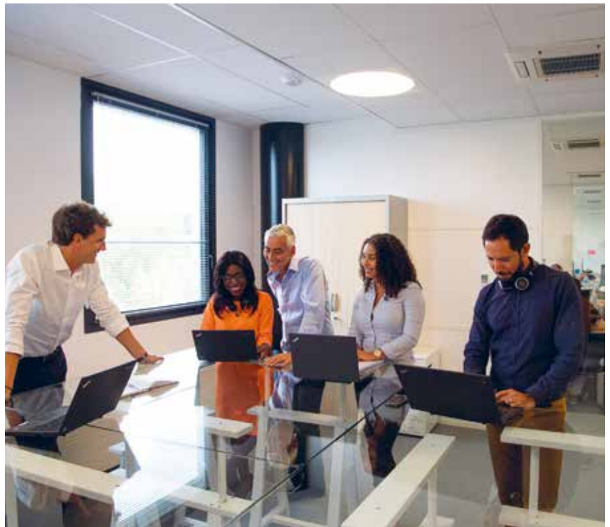
AXA WEALTH SERVICES SUR SON NOUVEAU SITE À MÉRIGNAC

Le temps où Mérignac était une commune mono-industrielle qui n'intéressait que les entreprises locales est terminé. Bien sûr, l'Aéronautique-Spatial-Défense constitue toujours l'ADN de la ville, et 80 % des transactions immobilières restent endogènes**, mais on note une nouvelle tendance : « Mérignac a changé de dimension. Nous