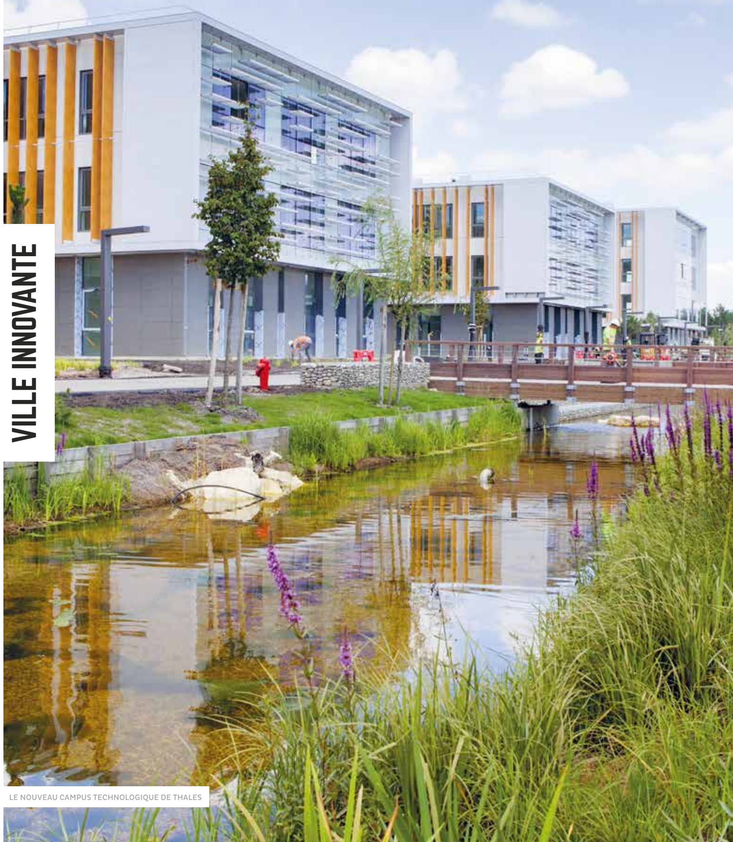
LE NOUVEAU CAMPUS TECHNOLOGIQUE DE THALES