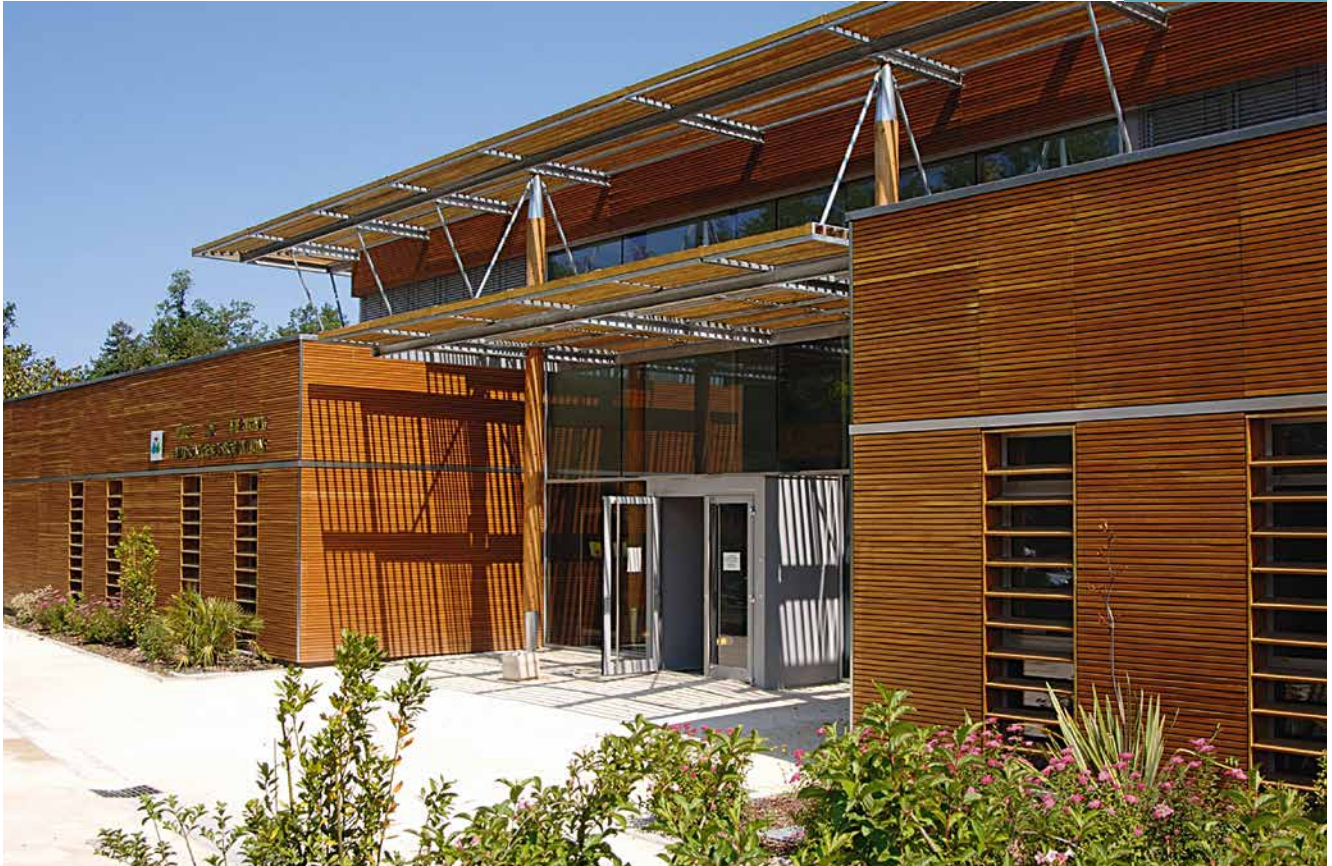
LA MAISON DES ASSOCIATIONS